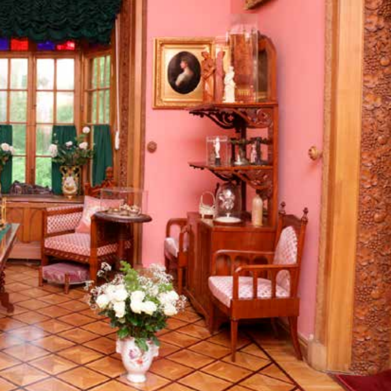
Кабинет Александры Фёдоровны. Общий вид

нике стояла миниатюрная бронзовая копия надгробия королевы работы Х. Д. Рауха. Особенно дорогая реликвия — фарфоровая чашечка, из которой королева Луиза пила молоко незадолго до рождения дочери, с надписью по-немецки на крышке бархатного футляра: «Прусская незабвенная королева Луиза пила из этой чашки свежее молоко 26 мая 1798 г. в Оливе Карлсберга у Данцига. Всё, к чему прикасается добрый человек — свято».