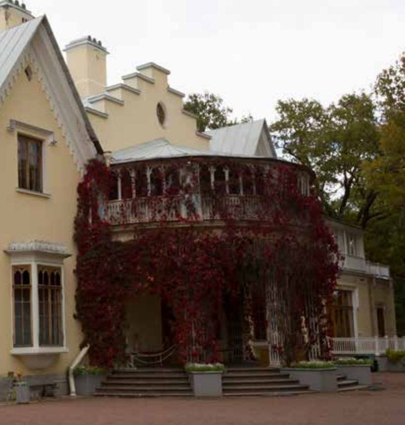
Вид на дворец «Коттедж» с юго-западной стороны

На протяжении XVIII столетия центром петергофской резиденции был Большой дворец, где, в основном, протекала парадная и частная жизнь российских императоров. Здесь давали аудиенции, принимали иностранных дипломатов, праздновали военные победы, устраивали балы и приёмы. Здесь же располагались личные апартаменты государей — «половины Их Императорских Величеств». В собственных покоях монарх никогда не оставался в одиночестве, ведь за закрытой дверью всегда дежурил караул, дожидались аудиенции министры; несколько шагов из личных апартаментов — и правитель оказывался в центре парадной жизни императорского Петергофа.