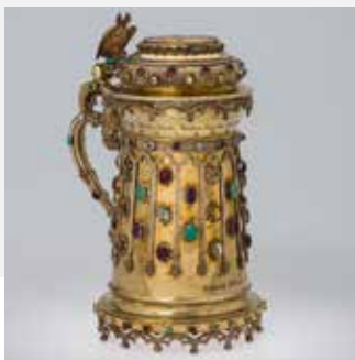
Кружка с именами членов русского императорского и прусского королевского домов