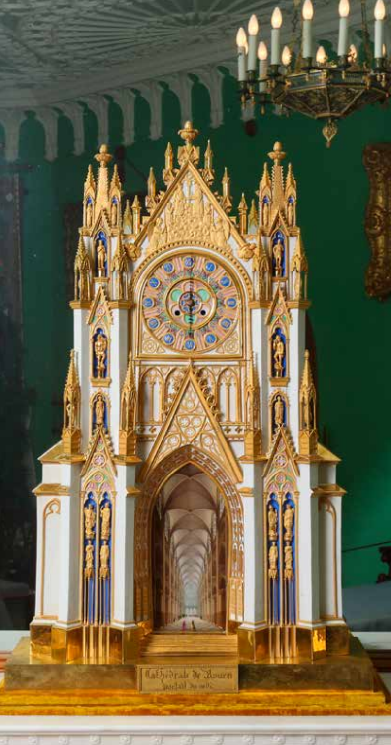
Cathédrale de Bourges Jouéux 2005